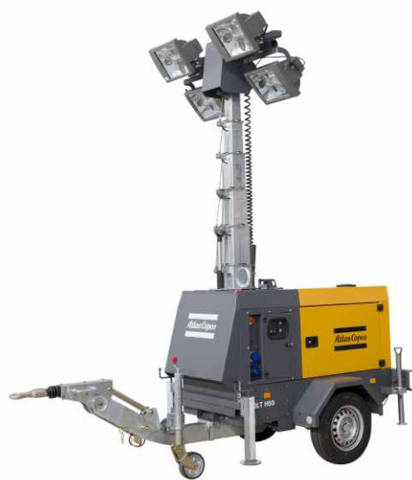
QLT H50 液压移动照明灯车