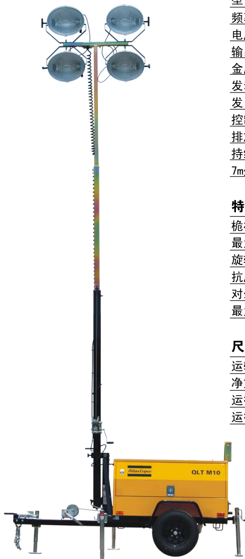
QLT M10 移动照明灯车