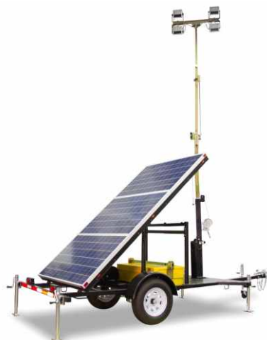
QLTS 太阳能移动照明灯车