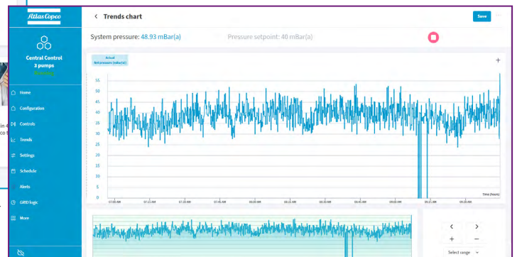
Zugriff und Visualisierung von Pumpentrends wie Druck und Temperatur