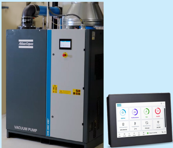
Bomba de vácuo de parafuso lubrificada a óleo GHS 2002 VSD+ da Atlas Copco e controlador HEX@™

Eles só precisam conectar a bomba de vácuo pela LAN à rede da empresa para acessar a interface de usuário da bomba.